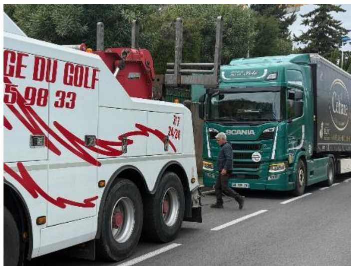
Figure 2 :Semi-remorque trop lourd ayant dû être remorqué jusqu'en haut du Chemin des Presses (photo 2 avril 2025)